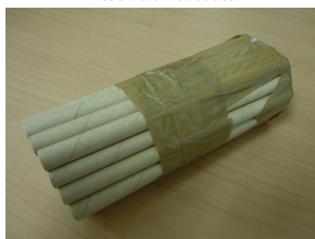
Assembler les tubes

Assembler les 32 tubes en carton entre eux avec du gros scotch. Les placer dans une bouteille en plastique dont vous aurez découpé le goulot.