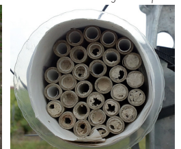
Suivi mensuel des loges occupées

Pour plus de renseignements vous pouvez nous contacter à l'adresse olb@cpie-meuse.fr