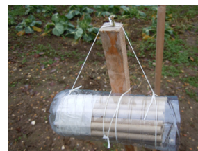
Placer les tubes dans la bouteille