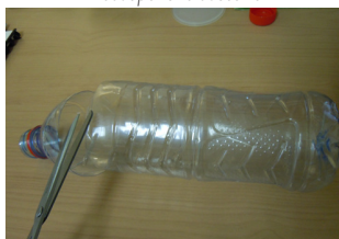
Découper une bouteille

Installation : poser les deux nichoirs espacés de 5 m l'un de l'autre sur la bordure d'une parcelle ou de votre jardin. Fixer les nichoirs horizontalement, sur des piquets, à un mètre de hauteur (pour éviter la prédation), dans un endroit ensoleillé, si possible abrités du vent et avec les ouvertures orientées sud.