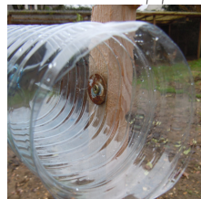
Fixer la bouteille au piquet

Observations : une fois par mois, noter sur la fiche d'observation qui vous sera fournie, le nombre de loges occupées, la nature du bouchon (terre, feuilles mâchées ou découpées, résine, coton...), la présence d'insectes visibles et leur nombre.